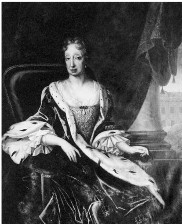
1660. aastal lesestunud Hedvig Eleonora elas kuni aastani 1715. David von Krafti maalitud portree pärineb samast aastast.

õigusega sellele eelisele. Taani saadik Stockholmis Jens Juel kirjutas kodumaale, et Ulrika Eleonora hoidus audientsidest ja ametlikest ülesastumistest eemale, kuna tema ees liikus alati leskkuninganna. Asi läks koguni nii kaugele, et välismaa diplomaatide seas tekkis segadus küsimuses, kelle juurde kahest kuningannast esimesena visiit teha. Ulrika Eleonora tõmbus kõrvale. Tema juures audientsi palunud saadikule kirjutas ta, et ei soovi auavaldusi, vaid rahu. Hedvig Eleonora eelisseisundile õukonnas aitasid kaasa ka Ulrika Eleonora sagedased haigused ning kõrvalejäämine pidudest ja ametlikest tseremooniast.