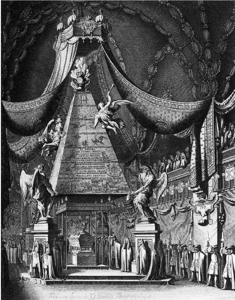
Ulrika Eleonora matused Riddarholmi kirikus. Castrum doloris'e, kirstu paigutuskoha enne matmist kujundas Nicodemus Tessin noorem. Jean Le Pautre'i gravüür.

Kiriku kaunistamine matusetseremooniaks usaldati Nicodemus Tessin nooremale, kes lõi Itaalia baroki stiilis kujunduse. Neli suurt allegoorilist, surma sümboliseerivat kuju hoidsid üleval hõljuvat valguspüramiidi. Püramiid oli kaunistatud kuninganna voorusi