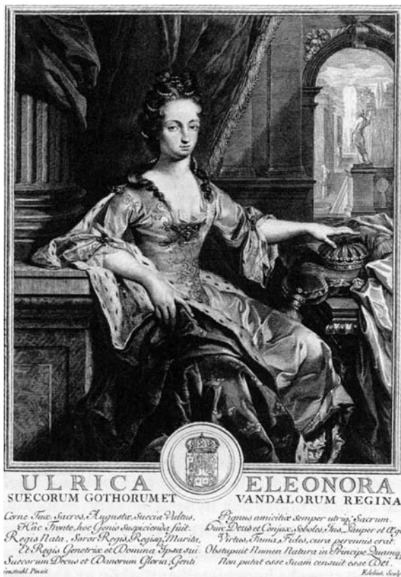
Ulrika Eleonora. Gérard Edelincki vaselõige D. K. Ehrenstrahli maali järgi, 1699.

lesk. Lilliega kohtusime varem kui Gustaf Adam Banéri näälu ja maalt välja saadetud Gustaf Lillie vennaga. Ulrika Eleonora heategevus oli sageli suunatud ühiskonna murelastele, halvatud sõjameestele, vaestele naistele, abi vajavatele veteran-trabantidele ja -ohvitseridele. Rahalise kingituse said temalt Ema Catrine vaeste naiste eest, keda ta lapsevoodis oli teeninud, samuti „lastekodu väike moorlanna”. Kuninganna rajas Kungsholmenile vaestemaja ja laskis 1687. aastal ehitada Johannese kiriku lähedale Kuninganna maja ( Drottninghuset ). Asutuses said varjupaiga 160 abivajajat ning selle ülalpidamiseks kinkis kuninganna