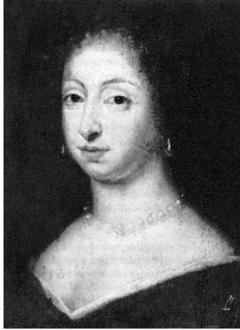
Hedvig Eleonora. D. K. Ehrenstrahli maal.

rahulduseks ja rõõmuks selles kaduvas maailmas, ja siis kui see elu on lõppemas, andku Jumal Tema Kuninglikule Majesteedile ja meile kõigile elu kroon, mis on hingede igavene õndsus, milleks Kristuse nimel aidaku meid Jumal!