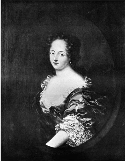
Maria Aurora Königsmarck, intelligentne, haritud, kaunis ja vaimukas naine, kes oli enam tuntud Saksi kuurvürsti August II armukesena. Kaasaegne maal.

päritoluga kaasnenud umbusaldamine, kuigi Ulrika Eleonora oli oma kuningale ja uuele kodumaale vankumatult lojaalne. Kuna tema õeldut ja tehtut tõlgendati sageli valesti, tuli ennast pidevalt jälgida. Umbusku võis loomulikult kohata Holsteini ämma, kuid mõnikord ka kuninga enda juures. Probleem võis esile kerkida täiesti erinevas kontekstis. Kui 1688. aastal 7-aastasele prints Karlile koduõpetajat määrati, olid Karl XI ja Hedvig Eleonora otsustanud õuekantsler Erik Lindschöldi kasuks. Ulrika Eleonora oli sellele kindlalt vastu, kuna kuninganna arvates oli Lindschöld kergemeelne, Taani-vastane ja Holsteini partei liige. Kuninganna vastuväited olid asjatud ning Karl nimetas Lindschöldi ametisse. Kui Lindschöld 1691. aastal suri, nimetas Karl uueks koduõpetajaks Nils Gyldenstolpe. Ka see oli Ulrika Eleonora tahte vastane samm.