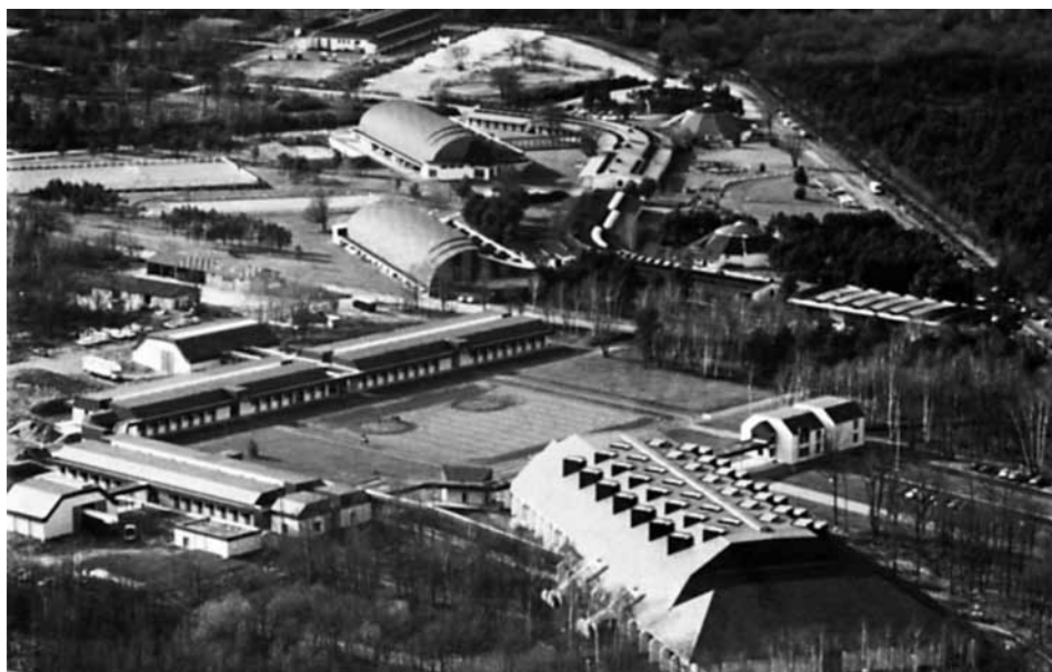
Vana ja uus Saumur.

stiil loob esmalt kerge ja liikuva suu, mis toob kaasa õige tasakaalu, raskuse paigutumise rohkem tagaotsale, saksa stiil aga seisab eelkõige harjutuste abil tasakaalu arendamises, kuni õiges tasakaalus hobune leiab ise ka õige ratsme kerguse. Prantslased tegelevat rohkem hobuse üksikute osade ja üksikute probleemidega, sakslased alati tervikuga.