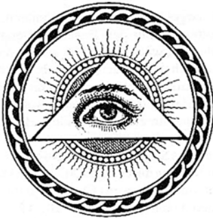
Taevajumala silm kolmnurgas.