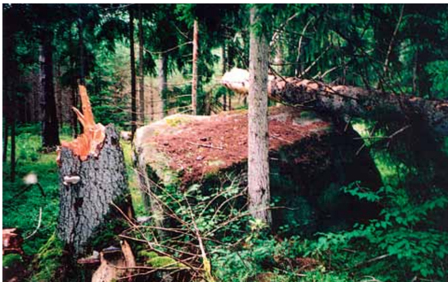
Üks tavaline ridakivi Meiuste kivistruktuurist. Enne, kui lageraie jõudis muinas-observatooriumi kirdesektorisse, oli siin ikka üksjagu ürgmetsa hõngu tunda.

See raamat on mõeldud väikeseks tähelepanuavalduseks Eesti riigile tema sajanda sünnipäeva puhul. See riik on olemas (kuigi loogiliselt võttes ei tohiks teda olla) ja väärib seda, et on. Ajalugu kohustab. Megaliitkultuur on öeldavasti üks tingimatuid eeldusi, mille põhjal määratleda kultuurirahvast. Miks mitte vähemalt üritada taastada oma koht vanade kultuurirahvaste seas? Ja mida varem, seda parem. Sest aeg võib otsa saada.