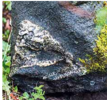
Silm ja kolmnurk Saaremaa muinasobservatooriumis, üks ühel, teine teisel pool kivi.