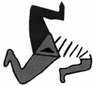
Päikesesümbol triskele Karja kiriku altariruumi lae all. Kui see kolmjalg ringi käiks, kujutaks seegi endast päikeseolendit ratta sees.