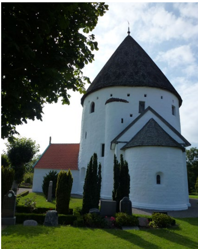
JOONIS 1.12. Olsi kirik Bornholmi saarel.

olema hästi nähtav neile, kes saarest möödusid. Järgmised ümarkirikud (Hagby ja Borgholm) paiknesid Kalmari väina ääres, mida pidid läbima kõik need, kes Liivimaale suundusid. Seega võib ümarkirikute püstitamises näha selget mustrit.