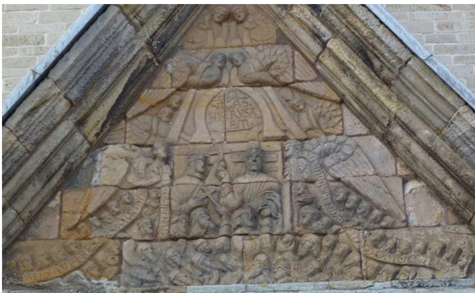
JOONIS 1.15. Ribe toomkiriku lõunaportaali viilu reljeefid.

Visuaalse propaganda kulminatsiooniks kujuneb aga Ribe toomkiriku lõunaportaali viilureljeefi programm, mis ülistab Taani teokraatlikku kuningavõimu ning garanteerib lunastuse neile, kes lähevad ristsisõtta (joonis 1.15). Kompositsioon on üles ehitatud inglitele, kes kannavad õlgadel stoolat. Kahe ülemise ingli stoolad moodustavad viilu keskel suure oomega, mille sees on kiri: CIVITAS HIERUSALEM. Tõlkida võiks selle Taevaseks Jeruusalemmaks. Kahe madalamal asetseva ingli stoolad ümbritsevad raamina suurt rahvahulka ning kannavad teksti: „ Öndsad on need, kes on vaimus vaesed, sest nende päralt on taevariik “ (Mat 5:37) ja „ Tulge, mingem üles Issanda mäele “ (Js 2:3). Taevase Jeruusalemma teksti all on kaks kroonitud figuuri, kelle identiteeti aitavad tuvastada tähed A ja W ning S. Maria. Suur rist Kristuse pea taga asendab ristiglooriat. Mõlemad figuurid hoiavad kinni kõrgele tõstetud ristist.