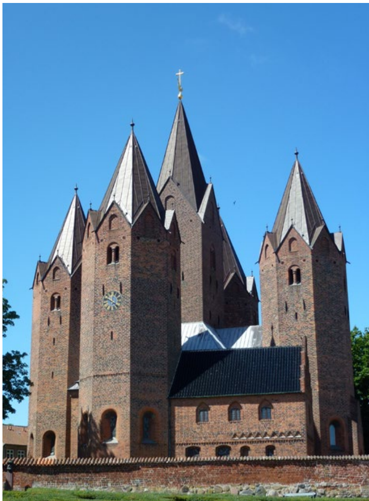
JOONIS 1.10. Kalundborgi Maarja kirik. Foto Kersti Markus.

sümboolselt Kristuse hauakirikut Jeruusalemmas. Paar kilomeetrit eemal ehitas tema võitluskaaslane Peder – naise kaudu Hvide – samasuguse oma linnusesse. Tõenäoliselt on Sunega seotud ka Püha Risti ümarkiriku püstitamine Selsø mõisa Roskilde fjordis, sest tema lapselapselaps oli kiriku omanik veel rohkem kui sajand hiljem.