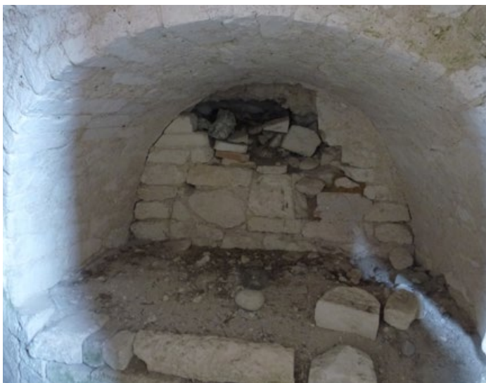
JOONIS 1.14. Kristuse hauda sümboliseeriv nišš Store Heddinge kiriku apsiidi peal.

väikesesse silindervõlviga ruumi, mida võiks pidada miniatuurseks käärkambriks. Sealt pääseb apsiiditaguse trepikäigu kaudu apsiidi võlvi kõrgusel asuvasse ruumi, milles võidi hoida reliikviat. Võidukaare seintest saavad aga alguse kaks keerdtreppi, mis viivad ülemise korruse galeriisse. Idaseina keskosas pääseb sealt neljakandilise ukseava kaudu paar astet madalamal tasapinnal paiknevasse U-kujulisse käiku. Ümmargused augud uksepiitadel annavad tunnistust kunagisest võrest, läbi mille oli võimalik vaadata laia ja sügavat ümarkaarset nišši, mis paikneb täpselt apsiidi kohal (joonis 1.14). Tõenäoliselt on tegemist sümboolse Kristuse hauaga. Silindervõlviga käik kulgeb ümber niši ning lõpeb mõlemal pool kambriga, neist lõunapoolses on väike altar ja valgusava. Nende käikude peal on aga veel üks tasand, mis kujutab endast avarat ruumi, hõlmates kogu apsiidi- ja koorivõlvi pealse osa. Tugevalt kulunud trepiastmed ja ruumi ebatavaline asukoht võiksid osutada palveränduritele. Store Heddinge oli kuningakirik, rajatud Valdemar II ajal.