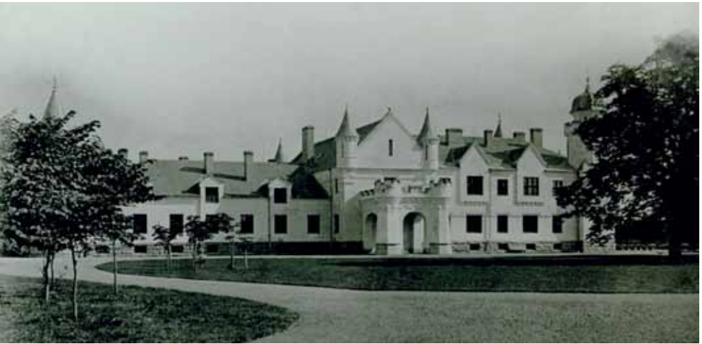
Vaade Alatskivi lossile 20. sajandi algul