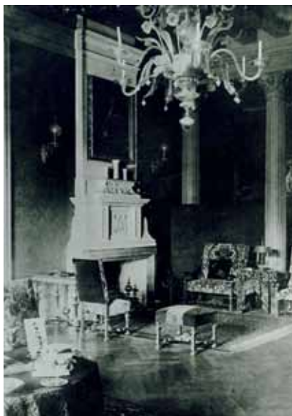
Vaade saali 20. sajandi algul