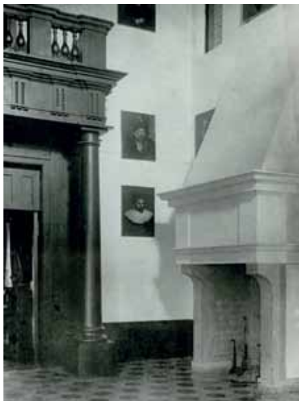
Lossi vestibüül 20. sajandi algul