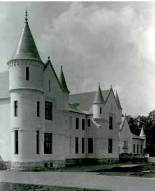
Vaade lossi tagafassaadile 20. sajandi algul

Karjamõisad: Kesklahe ( Kesklacht ), Lahe ( Lacht ), Rupsi ( Rupsi ), Vanamõisa ( Althof )