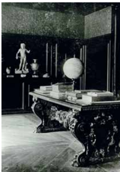
Vaade kabinetti 20. sajandi algul

Lossi vastas, teisel pool muruväljakut, paikneb punastest tellistest