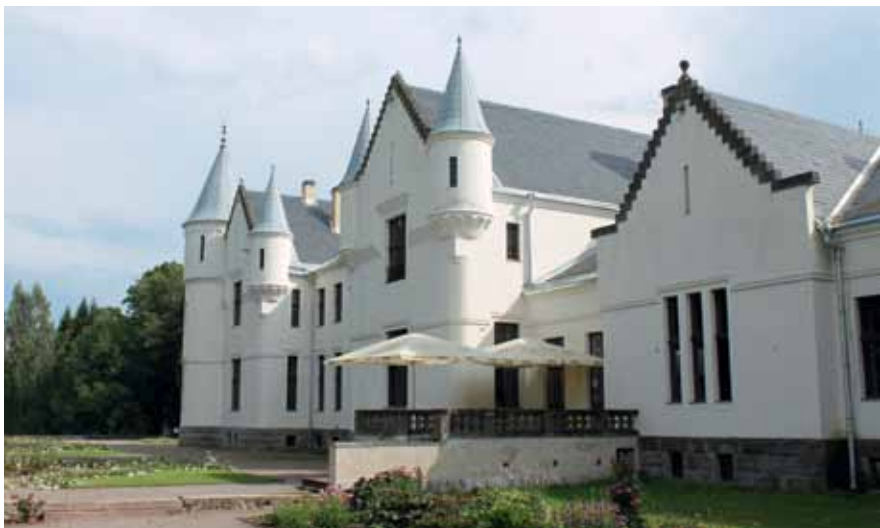
Vaade lossi tagafassaadile