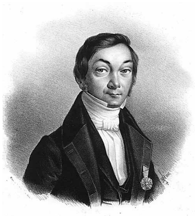
Friedrich Karl Hermann Kruse (1790–1866).