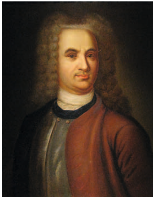
Vassili Tatištšev (1686–1750).

piirkonnas esialgu paigal, sest viikingieelsed russid ei olnud sõdalased. Viikingieelsel ajal võisid nad muuhulgas kaubelda klaashelmestega, mida on Laadoga kultuurkihist leitud üsna rohkesti.