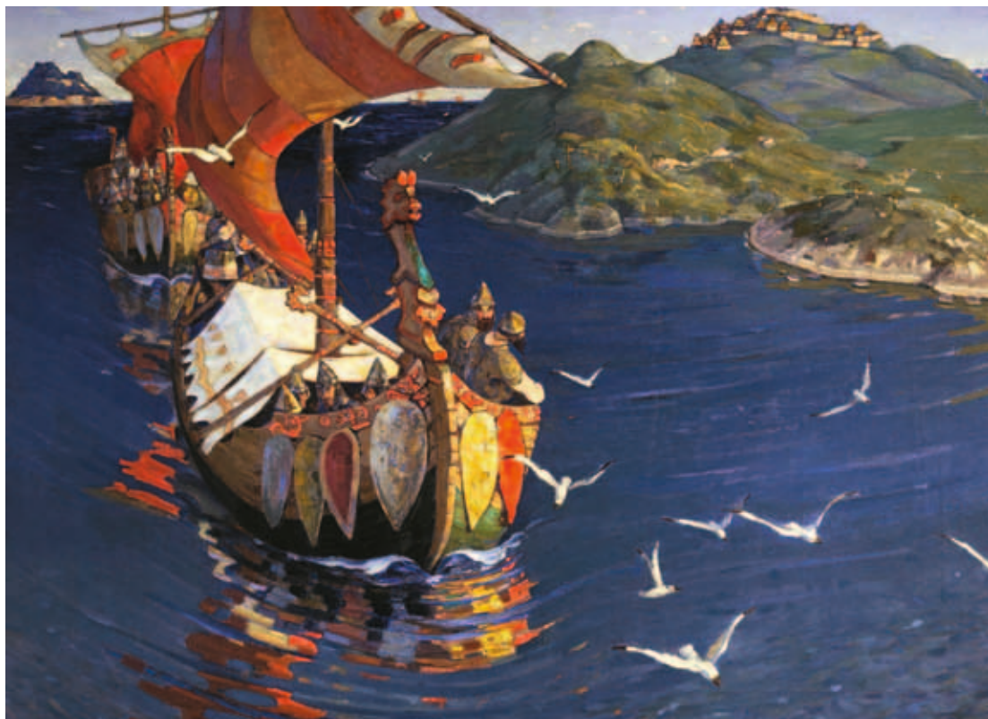
Nikolai Roerich. Meretagused külalised.

sloveenide, russide, tšuudide, krivitšite ja teiste rahvaste esindajad ning otsustasid valida endale kuninga võõrsilt. Järgmisel aastal mindigi russideks nimetatud varjaagide juurde ja tuldi tagasi Rjuriku suguseltsiga. Tatištšev ise arvas, et varjaagide all on mõeldud soomlasi.