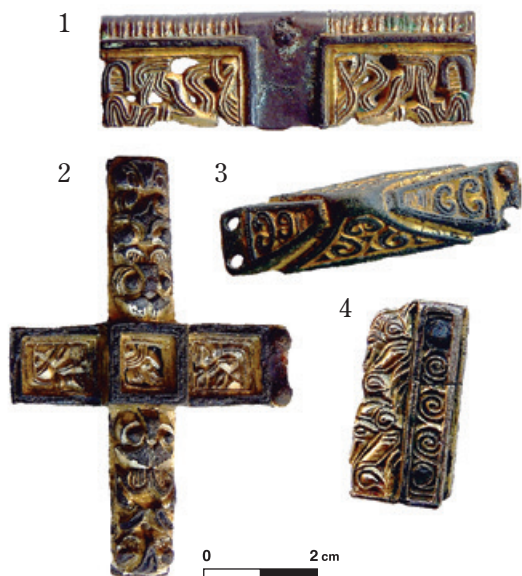
Joonis 1.4. Rahvasterännuaegsest Lõuna-Skandinaaviast Tallinna lähistele Proosa kalmesse jõudnud luksuslikke esemeid: mööganupp (3) ja metall-pealistised. TLM 15109: 136; 15740: 42; 14335: 18; 13943: 274.