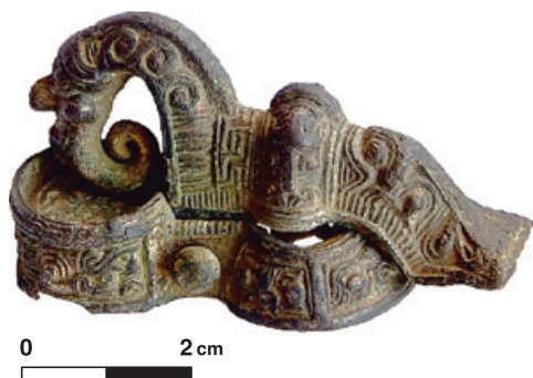
Joonis 1.5. Skandinaaviapärase ornamendiga 5.–6. sajandi ese Tallinna lähedalt Proosa kalmest, mille omaaegne funktsioon pole päris selge. Võimalik, et tegu on ebatavalise kujuga pandlaga. Kalmest kaevanud arheoloogid ristasid asjakese Pontuks. TLM 14847: 86.

päritolu 5.–6. sajandil valmistatud luksusasju (joonis 1.4). Kokku oli taolisi leide üle paarikümne, millest silmatorkavamad olid ajastule iseloomuliku rõngaspeamõõga nupp, võimalik et mingi kasti või isegi raamatu peal olnud kullatud pronkskaunistus ja veidi pannalt meenutav, ebaselge otstarbega, kuid väga peene töötuse ja ornamendiga loomapeaga ese, mille arheoloogid parema seletuse puudumisel ristasid Pontuks (joonis 1.5). Lisaks oli leidude hulgas koguni kuusteist hõbeda ja kullatisega agraffnööpi (joonised 1.6 ja 1.7). Neid ümmargusi loomornamendiga dekoreeritud nupukesi kandsid Põhjala pealikud mitmel pool oma kuue küljes, näiteks omamoodi mansetinööpidena varruka alläärel või vahel kuue alumistes nurkades. Mõned agraffnööbid võisid olla kinnitatud ka vööpandlale. Tervelt kuusteist nööpi andsid seega tunnistust kas erakordselt mõjukast pealikust, kes taolist toredust enesele lubada võis, või pigem ehk sellest, et Skandinaavia päritolu luksusasju oli antud kaasa mitmele surnule. Inimeste luud olid Proosal, nagu Eesti kalmetes tüüpiline, täielikult segamini.