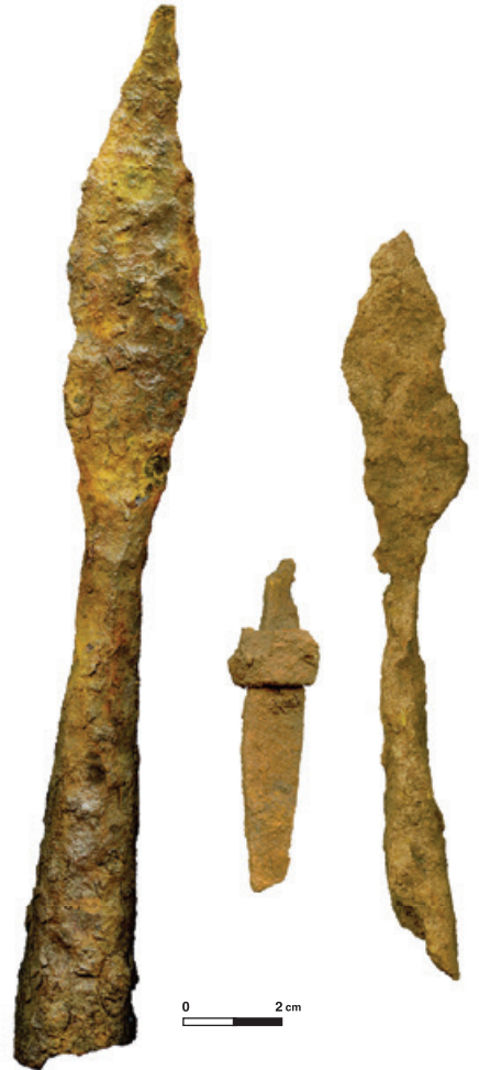
Joonis 1.2. Saaremaale Lepna surnumajja oli kogutud kokku suurem hulk relvi, millest enamik oli peaaegu tundmatuseni läbi roostetanud. Pildil on kaks paremini säilinud odaotsa ja võitlusnoa katke, kõik 6. või 7. sajandist. AI 6533: 1; SM 10372: 325, 16.

Relvade kaasapanemine kalmetesse lõppes õige pea, arvatavalt juba 7. sajandi lõpuosas. Tegelikult näis üldse lõkavat komme surnutele teispooldusse asju kaasa anda, sest kuigivõrd pole leitud ka muid esemeid. Mõnedel Eestit ümbritsevatel aladel olid sel perioodil rohkete relvadega matused tavapärased ja seal räägitakse