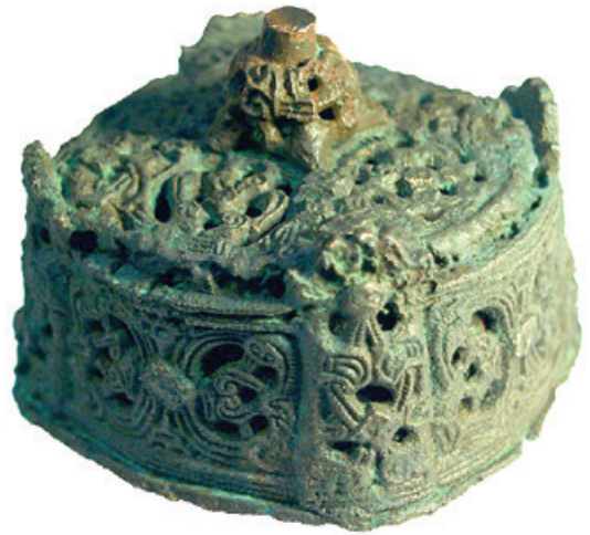
Joonis 1.3. Varaviikingiaegne topsikujuline sõlg Kasarist Lääne-Eestis. Selliseid sõlgi kandsid jõukad Skandinaavia naised.

Üks koht Põhja-Eestis, kust Permi päritolu vöönaaste leitud, on Proosa kiviakme Tallinna lähedal, kahe ja poole kilomeetri kaugusel Iru linnusest ja asulast. 10 See oli kohalikes oludes täiesti tavapärane, pikemat aega kasutusel olnud kiviakme, millest saadud rikkalikust leiumaterjalist lõviosa esindas samuti täiesti kohapealseid esemetüüpe. Leiti ka päris palju 5.–6. sajandi relvi. Lisaks Permi naastudele tuli kalme kivide vahelt välja kogum Lõuna-Skandinaavia