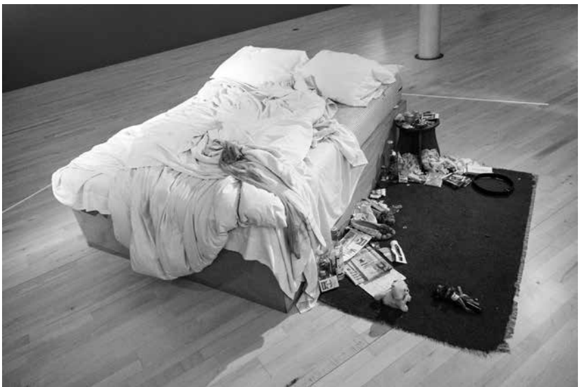
Minu voodi. Tracey Emin. Tate Modern, London, 1999.