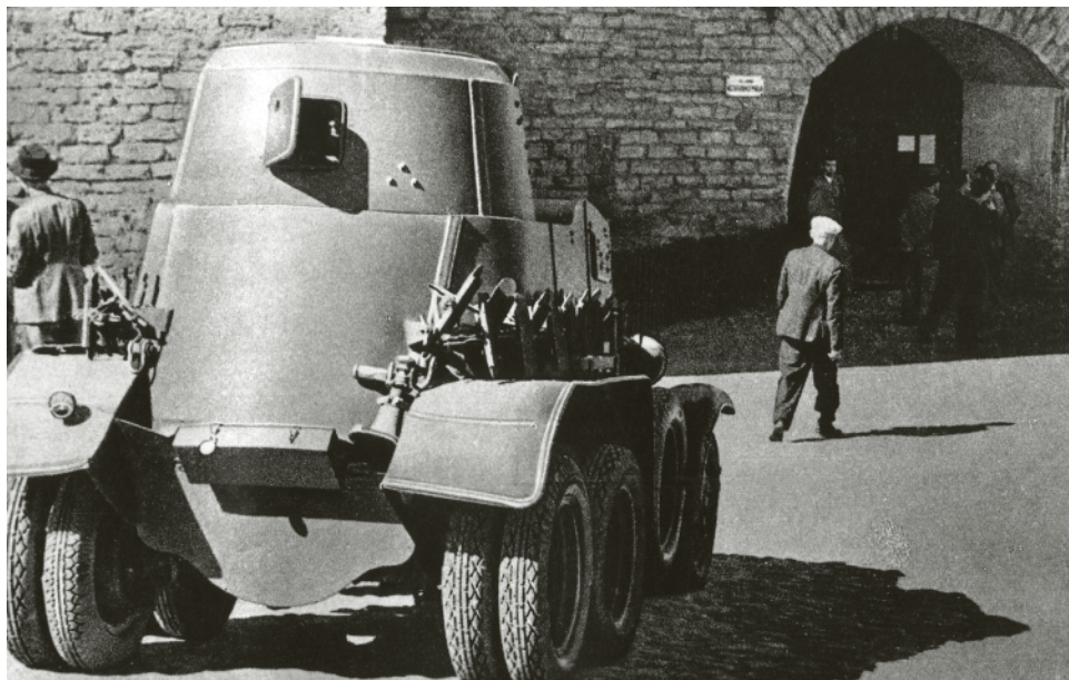
Nõukogude Liidu soomusauto 21. juunil 1940 keskvangla ees poliitilisi vange vabastamas.