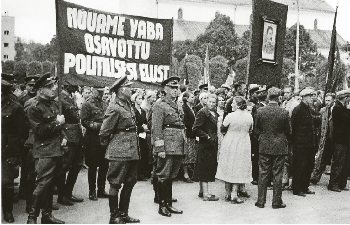
Miiting Vabaduse väljakul 1940. aastal.