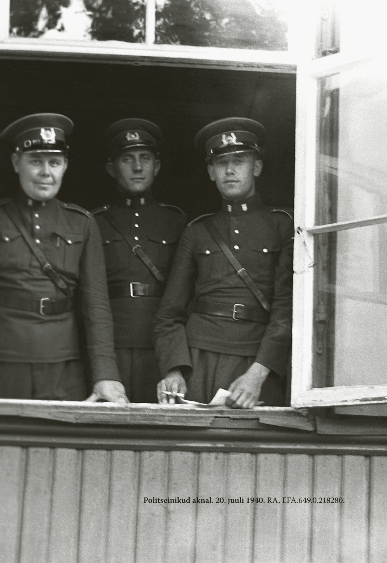
Politseinikud aknal. 20. juuli 1940.