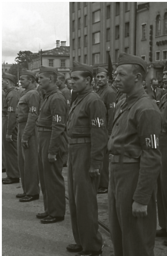
Töölise ja sõdurite meeleavaldus Vabaduse väljakul Riigivolikogu uue koosseisu valimiskampaania alguses. Rahva Omakaitse rivis. 6. juuli 1940.