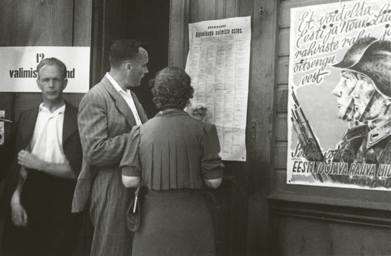
Eesti NSV Riigivolikogu valimiste eel 12. valimisjaoskonnas.