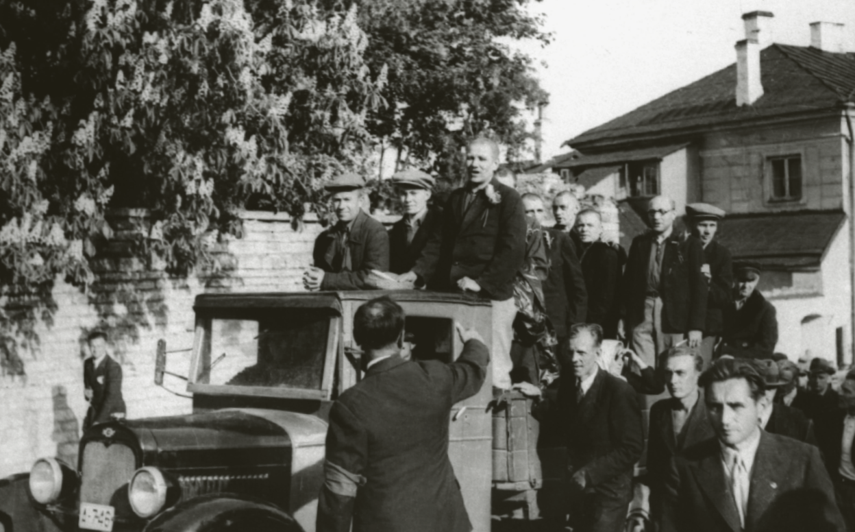
Veoauto vabastatud vangidega teel Toompeale 21. juunil 1940.

Kadriorust liikusid mässulised keskvanglasse vange vabastama. Mälestuste järgi julgestasid mässulisi mõned punaväe soomukid. 39 Vangla direktori juurde saadeti viieliikmeline delegatsioon koos NSV Liidu kolme ohvitseriga, kes nõudsid poliitiliste vangide väljaandmist. Vabastati 27 vangi, 40 kellest enamik viidi hotelli Kuld Lõvi sööma ja ööbima. 41 Keskvangla naabruses asusid Eesti Õhukaitse staap ja suurtükiväegrupp, mille ülesanne oli muu hulgas turvata keskvanglat. Nõukogude sõjaväelased sundisid relva ähvardusel Eesti sõjaväelasi relvi ära andma. 42 Nõukogude sõjaväelased liikusid edasi Männiku laskemoonaladude juurde, kuid seekord siiski taandusid. 43